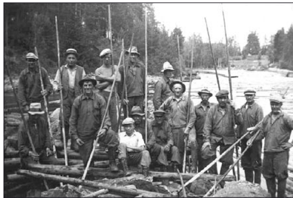
Flottarlag från slutet av 1930-talet

Vill ni boka exempelvis flottarkojan för övernattning, ha något arrangemang för ert företag, förening, eller varför inte er födelsedag, ordnar vi gärna med den detaljen. Är ni en grupp, eller ett större sällskap kan vi erbjuda er en guidad vandring. Hör med oss, om era önskemål.