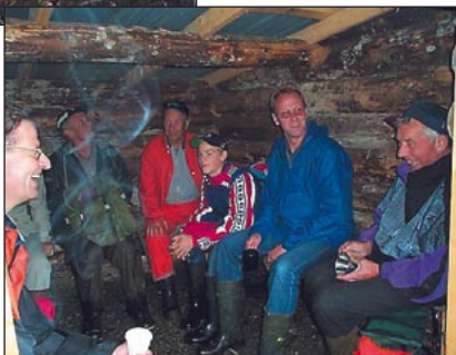
Trivselstund vid ett av de mysiga vindskydden. Detta vid posi- tion 6

Voxnan i vacker försom- margrönska mellan position 2 och 3.