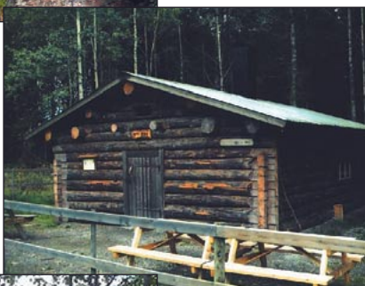
Flottarkojan, vid position 7

Voxnan uppströms Runemogårds- strömmen, strax intill position 5.